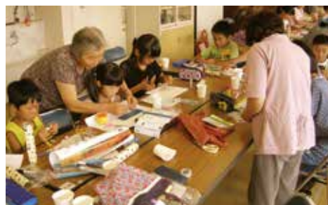
ふるさと少年教室