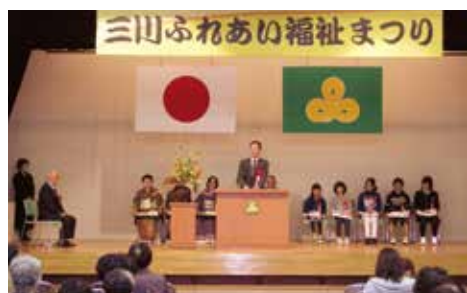
ふれあい福祉まつり