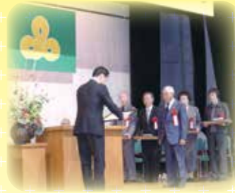
社会福祉功労者表彰