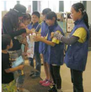
町内の小学生ボランティアによるイオン三川店での街頭募金の様子

三川町の皆さまからご協力いただいた募金は、山形県共同募金会に送金されます。その後、三川町の地域福祉の推進のため、山形県共同募金会から三川町社会福祉協議会に配分されます。