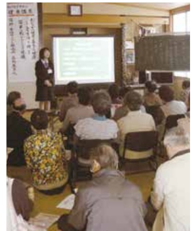
サロン実施町内会 施設整備補助事業費 (楽座いす)

老人福祉活動費／高齢者筋力トレーニング教室事業／高齢者生きがい支援事業費／移動サービス事業費／サロン実施町内会施設整備補助事業費／障害者支援事業費／児童・青少年福祉活動費／異年代交流事業費（ふるさと少年教室）／子ども広場遊具整備費／母子・父子福祉活動費／緊急連絡カード作成費／ボランティア活動育成事業費／ボランティア養成事業／ふれあい福祉まつり