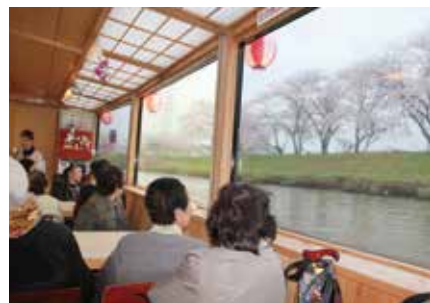
4/17 屋形船よりお花見