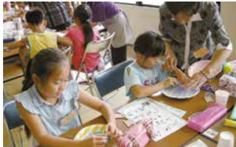
異年代交流事業（ふるさと少年教室）