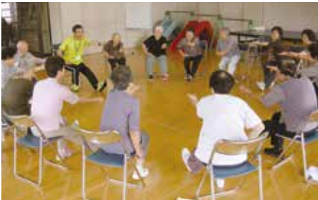
高齢者筋力トレーニング教室