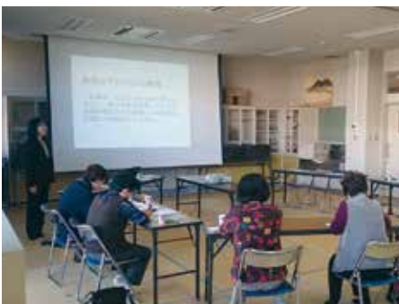
ボランティア養成講座

老人福祉活動費／高齢者筋力トレーニング教室事業／高齢者生きがい支援事業費／移動サービス事業費／サロン実施町内会施設整備補助事業費／障害者支援事業費／児童・青少年福祉活動費／異年代交流事業費（ふるさと少年教室）／子ども広場遊具整備費／母子・父子福祉活動費／緊急連絡カード作成費／ボランティア活動育成事業費／ボランティア養成事業／ふれあい福祉まつり