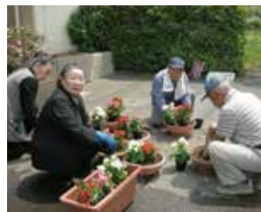
5/15 福祉センター花植え

社会福祉協議会では、一人暮らしのお年寄りがより健やかで安心した生活を送れるように会食交流会を年8回開催しています。 民生児童委員厚生部のみなさんが調理してくださる美味しい食事と交流会を通して、外に出る機会と元気を提供しています。