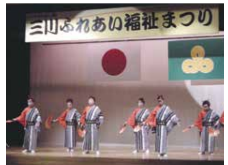
三川ふれあい福祉まつり