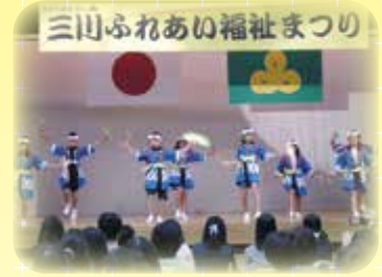
オープニング御神楽