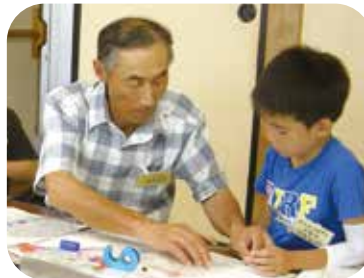
パラシュート作り