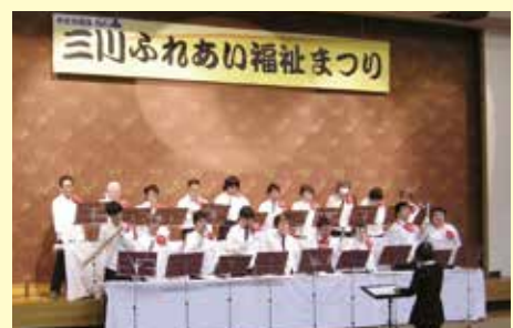
ふれあい福祉まつり