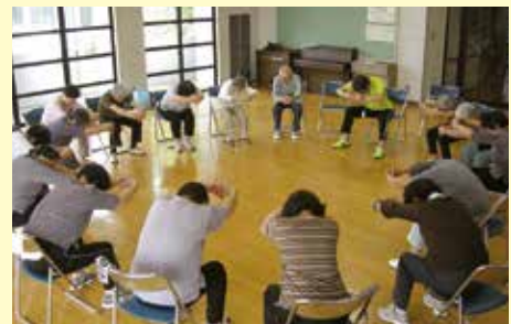
筋力トレーニング かめコース