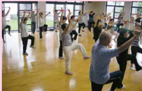
筋力トレーニングうさぎコース