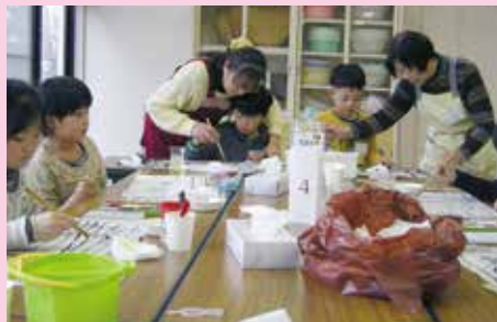
ふるさと少年教室