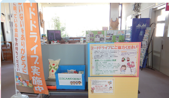
社会福祉センターフードドライブ