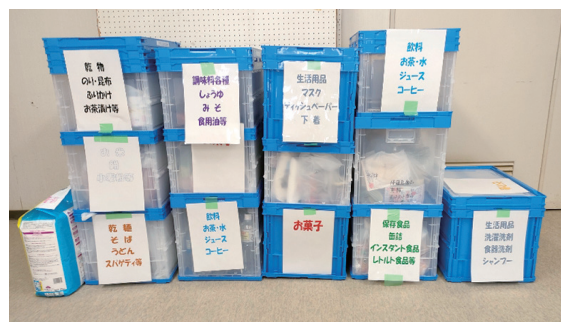
ボランティアさんによる仕分け